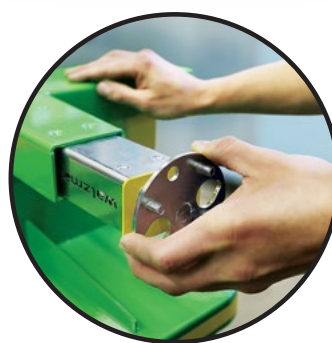
лёгкий монтаж и обслуживание

Наши изделия имеют большой запас прочности.