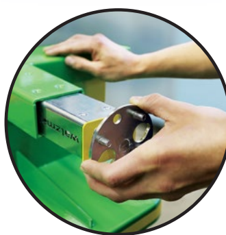
лёгкий монтаж и обслуживание

Наши изделия имеют большой запас прочности.