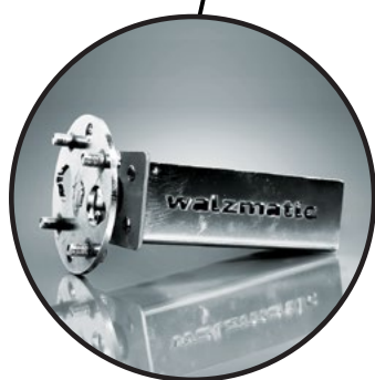
полуось на подшипниках